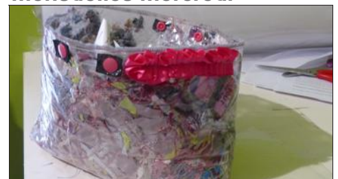
■ Un exemple de recyclage plastique et bouts de tissus.

La Bricolerie lance ses soirées mensuelles mercredi